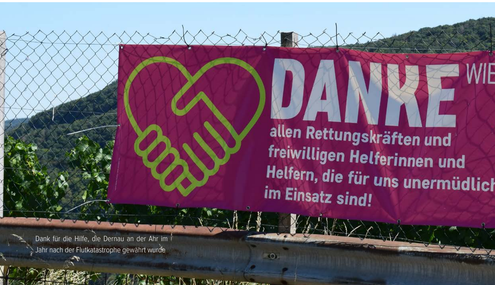
Dank für die Hilfe, die Dernaun an der Ahr im Jahr nach der Flutkatastrophe gewährt wurde

In Deutschland engagieren sich rund 29 Millionen Menschen ehrenamtlich in Vereinen, sozialen Einrichtungen, im Umweltschutz, in der Katastrophenhilfe, der Kultur und vielem mehr. Dank ihres Engagements gibt es viele wundervolle Dinge, die sonst schlicht nicht möglich wären. Doch ein Ehrenamt ist nicht nur ein selbstloser Dienst am Gemeinwohl, sondern schenkt viel Lebenssinn. Grund genug, dieses Engagement zu würdigen und zu wertschätzen. Und vielleicht bekommen Sie ja auch Lust, sich ehrenamtlich für die gute Sache einzusetzen.