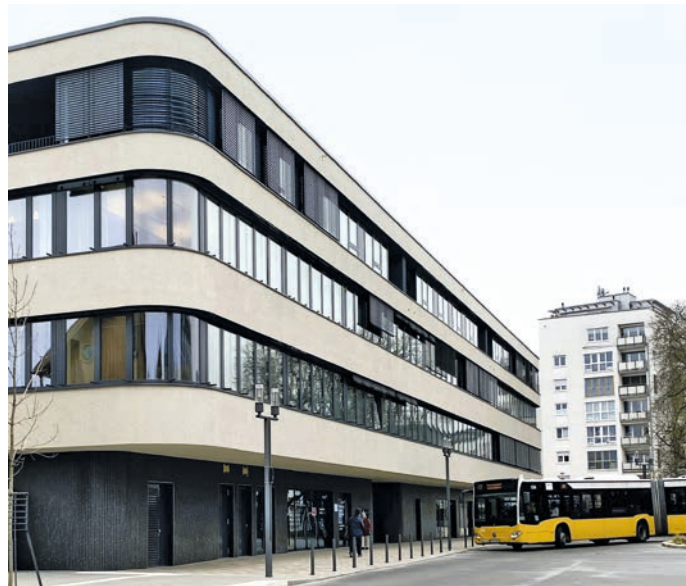
... und durch ihre zentrale Lage besonders gut zu erreichen.