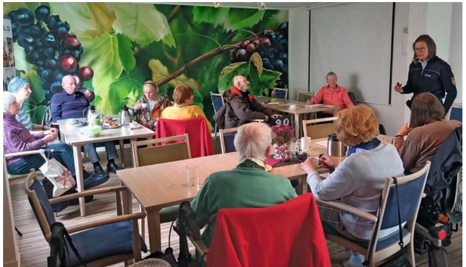
Informationsvortrag der Polizei im WohnCafé Ehrlichweg

Mitte Oktober letzten Jahres gab es hierzu beispielsweise im WohnCafé Ehrlichweg in Stuttgart-Fasanenhof einen entsprechenden Vortrag. Eine Polizistin des Referats Kriminalprävention berichtete über die neuesten Trickbetrügereien und beantwortete die Fragen der Teilnehmerinnen und Teilnehmer. Ebenfalls in Zusammenarbeit mit