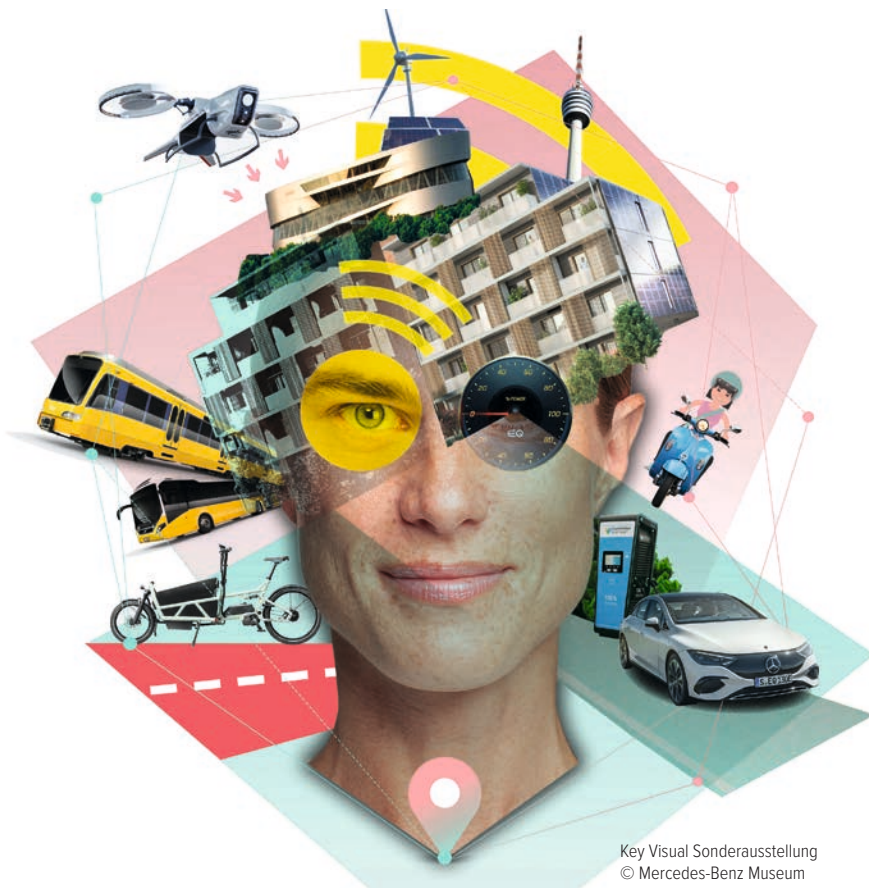
Key Visual Sonderausstellung

Wie gelingt Mobilität heute und in den kommenden Jahren? Welche Bedeutung nehmen dabei autonomes Fahren sowie smarte E-Bikes ein? Und brauchen wir Busse auf Bestellung oder Lieferdienste rund um die Uhr? Mit Fragen wie diesen beschäftigt sich das Mercedes-Benz Museum bis zum 17. November 2024 im Rahmen der Sonderausstellung DER MOBILE MENSCH – DEINE WEGE. DEINE ENTSCHEIDUNGEN. DEINE ZUKUNFT.