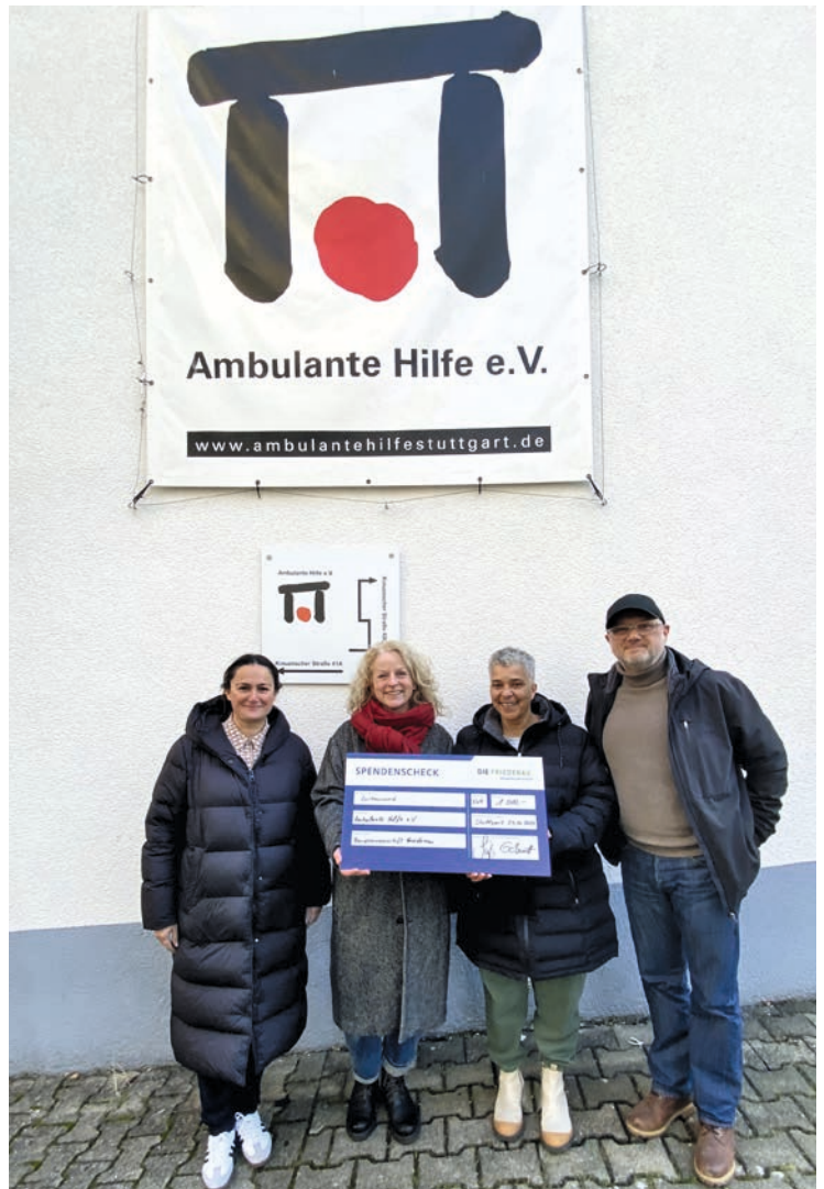
Die Friedenau unterstützt die Ambulante Hilfe e. V. mit einer Geldspende.

Die Friedenau hat sich 2023 gegen den Versand von Weihnachtsgeschenken entschieden und unterstützt durch den eingesparten Betrag unter anderem die Ambulante Hilfe mit einer Geldspende.