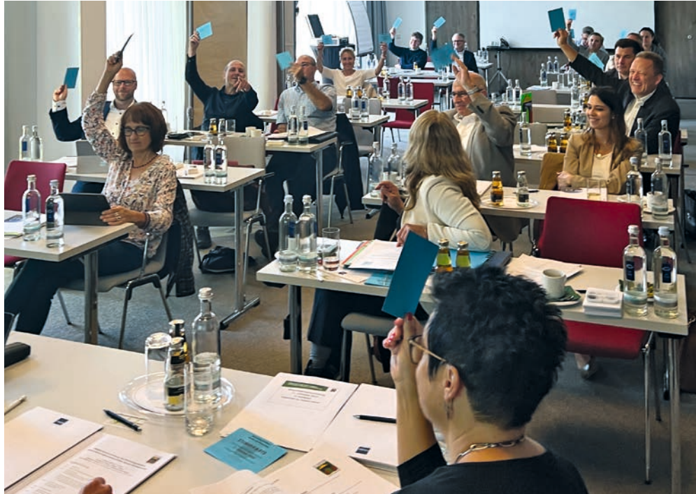
Vertreter von 24 Wohnungsgenossenschaften stimmten der Verschmelzung zu.

Vor mehr als fünfzehn Jahren haben mehrere Wohnungsbau-genossenschaften die Initiative ergriffen und sich für gemeinsame Marketingaktivitäten zusammengeschlossen. Inzwischen vereint die Marketinginitiative der Wohnungsgenossenschaften Deutschland e. V. rund 400 Wohnungsgenossenschaften mit knapp 900.000 Wohnungen – darunter die beiden Regionalverbände Baden-Württemberg und Stuttgart, die seit Jahren eng miteinander zusammenarbeiten.