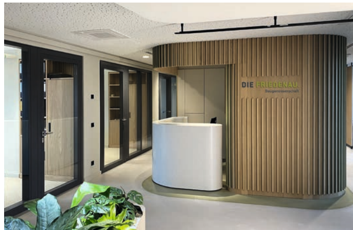
Die Räumlichkeiten der neuen Geschäftsstelle sind einladend gestaltet ...